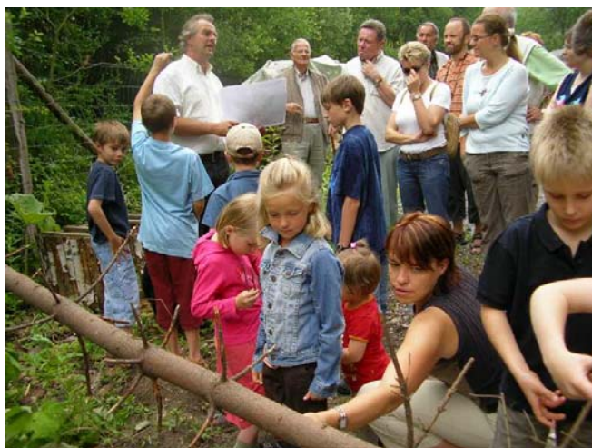
Vermittlung von Wissen: sprachlich angemessen, erlebnis- und erfahrungsorientiert