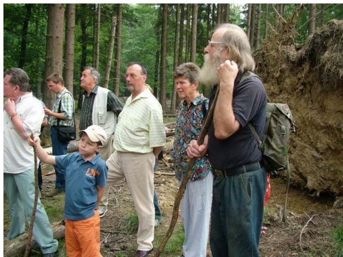
Jung und Alt machen sich gemeinsam auf den Weg, die Welt mit all ihren Geheimnissen zu erforschen