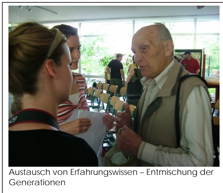
Austausch von Erfahrungswissen – Entmischung der Generationen

Zusammengehörigkeitsgefühl zwischen den Generationen entsteht durch intensiven Austausch und gegenseitiges Kennenlernen über die Altersgrenzen hinweg. Nur durch das Kennenlernen der Perspektive des Anderen kann Verständnis entstehen. In der