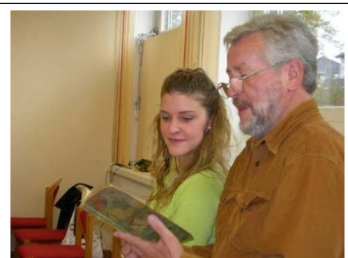
Kontakte zwischen den Generationen aktiv und nachhaltig fördern

Die Akademie 6-99 hat sich zum Ziel gesetzt, alle Generationen durch ein gemeinsames Interesse an Bildung zusammenzuführen. Die Akademie vertritt die Auffassung, dass Bildung ein partizipatives Allgemeingut darstellt, das allen Altersgruppen und allen Teilen der Gesellschaft zugänglich sein muss. Noch immer sind aber die Bildungsangebote und -möglichkeiten viel